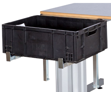
Sidobacks-hylla, ställbar för plastbackar i olika storlekar.

Rekommenderat arbetsområde för händerna (mätt i centimeter enl. AFS1998:1).